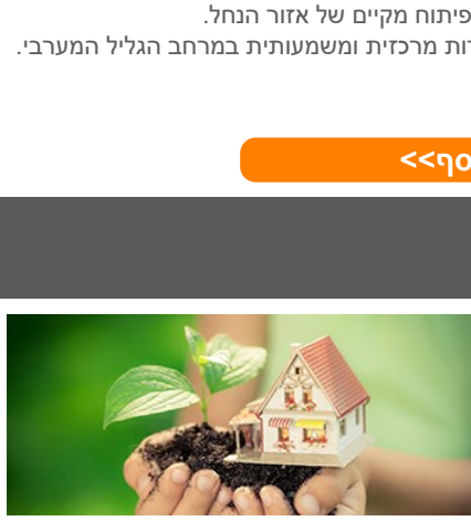
עדר | טבע עירוני

התמודדות עם משבר האקלים | מיפוי מגוון ביולוגי