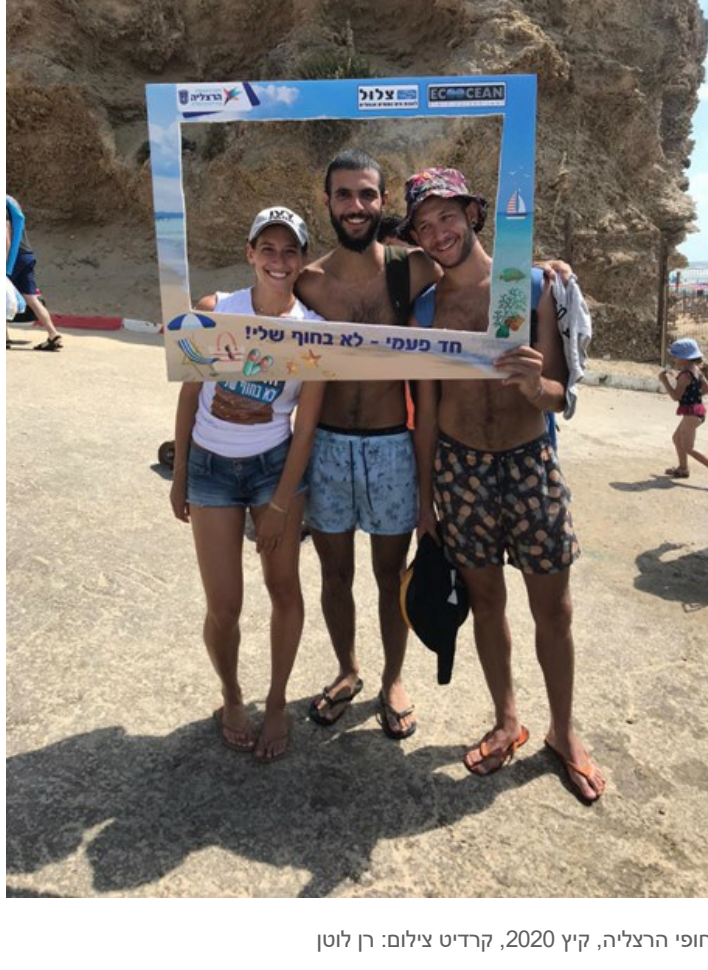
הסברה בחופי הרצליה, קיץ 2020, קרדיט צילום: רן לוטן

עמותת צילול פועלת בשיתוף פעולה הדוק עם רשויות מקומיות ברחבי הארץ כדי לקדם מדיניות סביבתית, למניעת זיהומי ים ונחלים, מצמצום השימוש בפלסטיק חד-פעמי וניהול סביבתי של זרמי הפסולת.