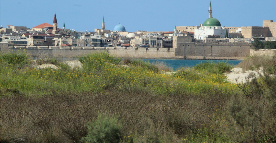
דינות חול בחוף עכו הדרומי.