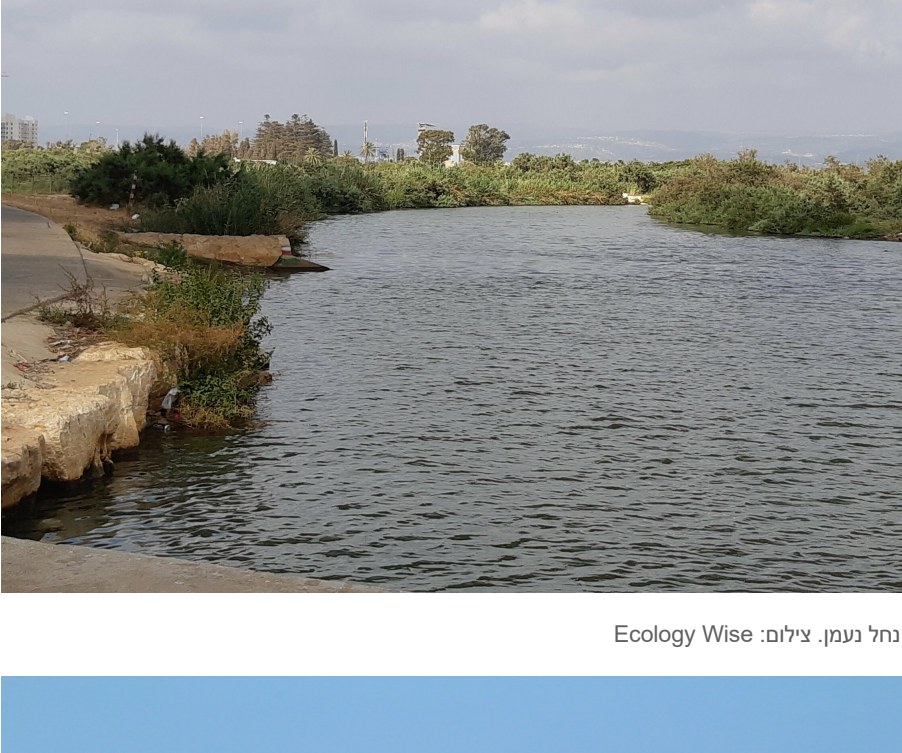
נחל נעמן.